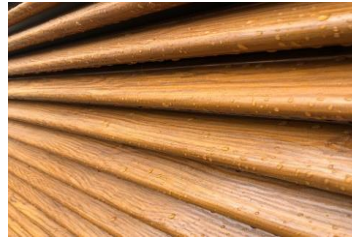
Ламель симметрика устанавливается на заклепки ф4,8мм или при помощи лепестковых с шагом 60мм. Мин. длина 0,45м, рекомендуемая макс. длина до 3м