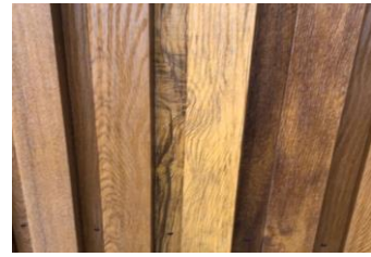
Рейка крепится на каркас при помощи окрашенных заклепок или саморезов. Максимальная длина 3м.